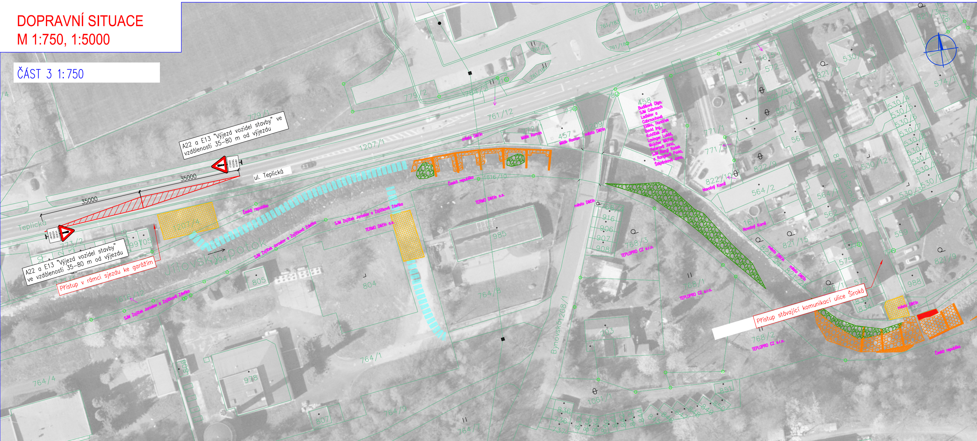
ČÁST 3 1:750